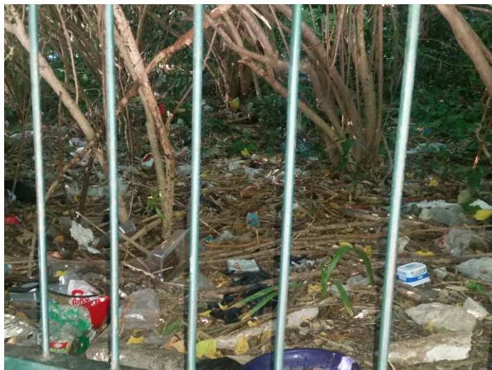
2 metra od kontejnera ispred Lapdske škole