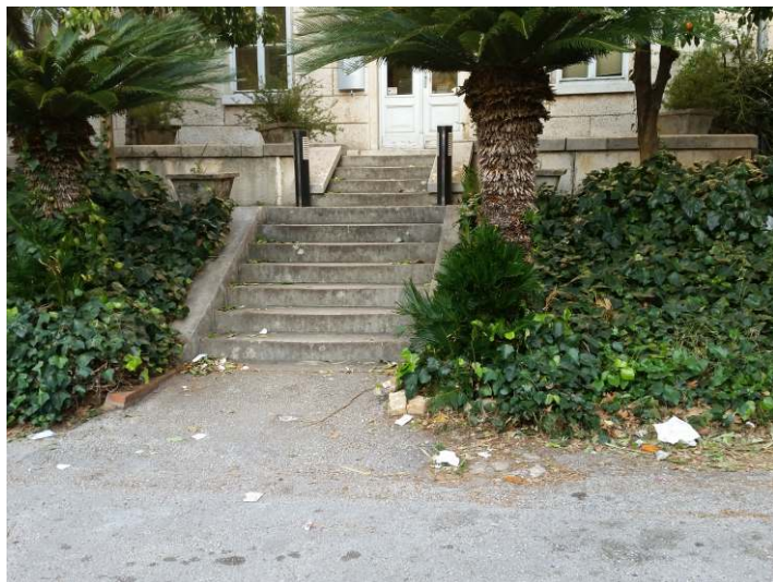
Ispred Splitske banke