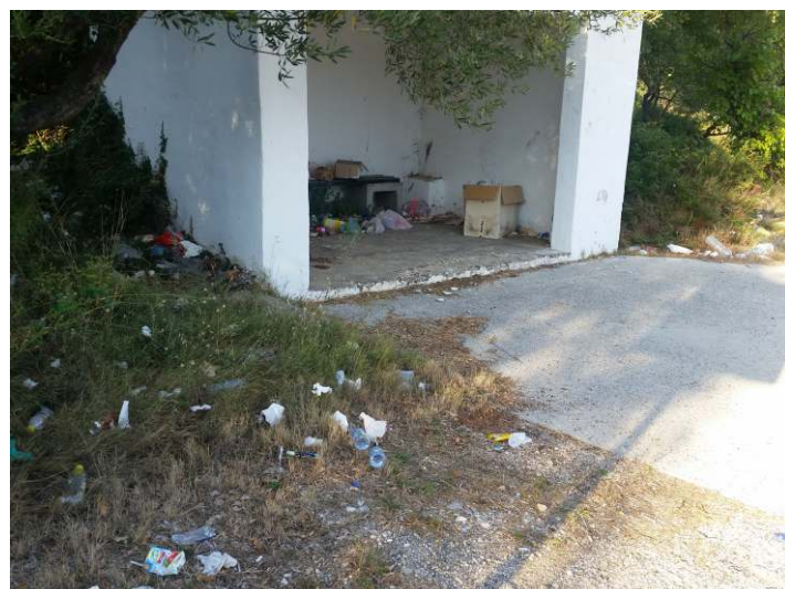
Autobusna čekaonica u Dolima