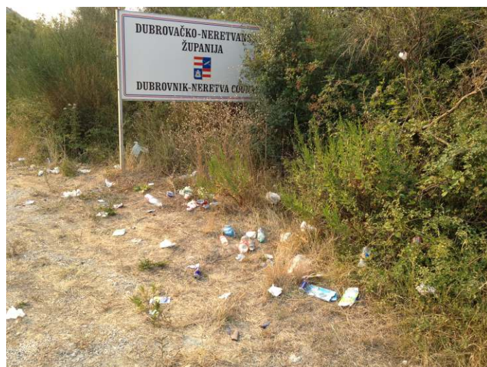
“Prirodne” ljepote Konavala