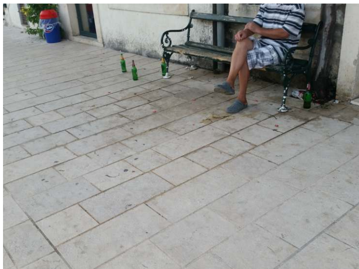
Ispijanje alkohola ispred svake butige u gradu