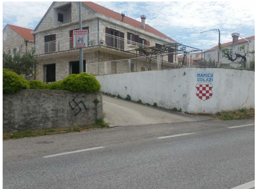
Dobrodošlica u Cavtat. Hrvatski grb ispod Mamićevog imena i svastike s lijeve strane (Zvekovica)