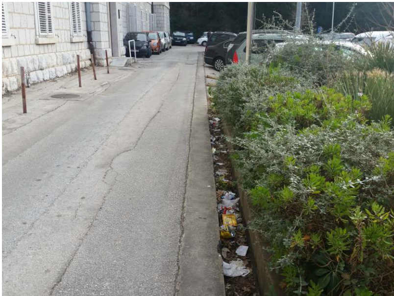
Mercante - Ured državne uprave DNŽ