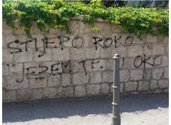
Ispred škole na Pločama