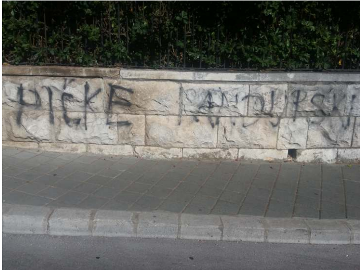
Kraj pošte Lapad