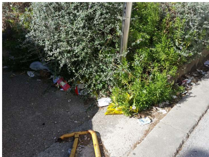
Oštećena ograda i hrpe smeća na svakom kantonu