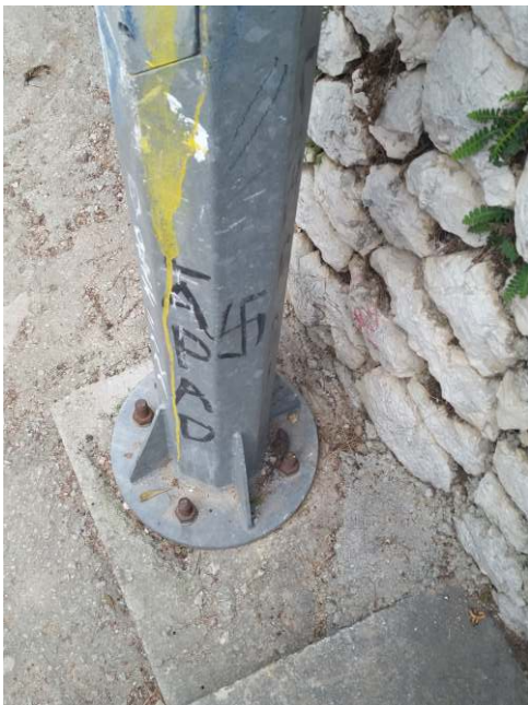
Ovo nitko ne primjećuje po cijelom gradu?